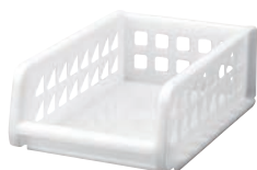
① プレクシーラック ナチュラル B5