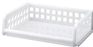
③ プレクシーラック ナチュラル B4