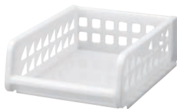
② プレクシーラック ナチュラル A4