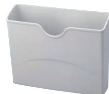
⑩ 分別ポケット P-1S

外寸:296×117×H116 材質:本体 / ポリプロピレン 耐荷重:3.0kg 付属品:吸盤 / エラストマー