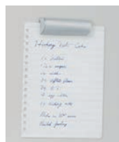
⑪ 18-8 イージークリッパー