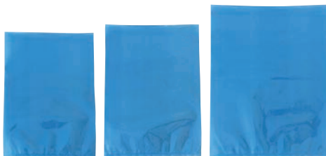
⑤真空包装機専用規格袋 青 構成: Ny / 接着層 / LL (袋厚0.08)