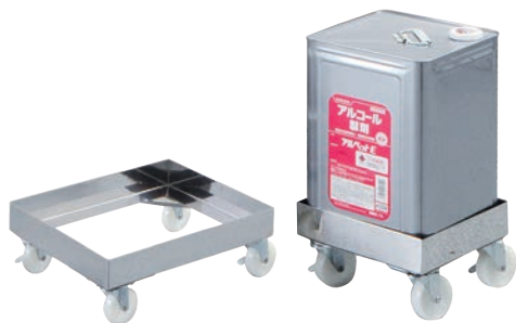
①EBM SUS442 角型キャリア 375 460