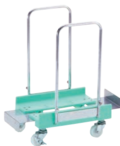
②袋キャリア ㊦ ㊧ ㊨ ㊩

385×470×H160 有効内寸:375×460 キャスター:ナイロン製 φ75 (自在×4、ストッパー2ヶ付) キャスター耐荷重:約120kg 適合商品:瓶ビールケース