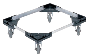
④サンコー ビールコンテナ用 サンキャリアー SH-2 ㊫

φ420×H150(φ320) キャスター:ナイロン製 φ75 (自在×4、ストッパー2ヶ付) 最大積載荷重:150kg