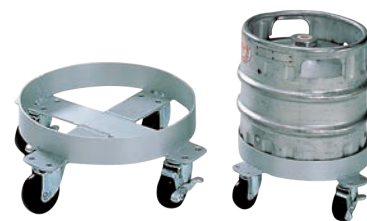
③アルミ 生樽用 台車 ㊪

420×270×H510~750 材質:本体/ポリプロピレン ハンドル/伸縮タイプ キャスター:ナイロン製 φ75 (自在×4、ストッパー2ヶ付) ●持ちにくく、運びづらかった袋物がラクラク運搬 ●ハンドルが上下に伸縮自在で、袋をたてに置いて移動できます。