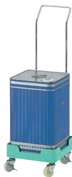
⑧缶きちキャリアー ステンレスハンドル付 ㊯

260×260×H135 有効内寸:240×240×H105(φ275) 材質:ポリプロピレン キャスター:ナイロン製 φ50 (自在×4、ストッパー2ヶ付) 最大積載荷重:60kg ●角型の一斗缶と丸型ビール缶をのせることのできるプラスチック製キャリアー