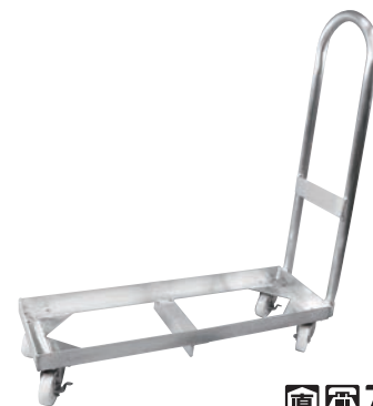
⑨アルミ製 一斗缶台車 H型 3缶用 ㊰

260×260×H785 有効内寸:240×240×H105(φ275) 材質:ポリプロピレン、ハンドル/18-8 キャスター:ナイロン製 φ50 (自在×4、ストッパー2ヶ付) 最大積載荷重:60kg