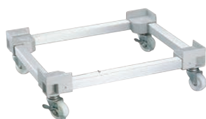
⑤ビールコンテナ用 台車 AP-No.20 ㊬

480×400×H195 有効内寸:460×375 材質:本体/ポリプロピレン アングル/アルミ キャスター:ナイロン製 φ100 (自在×4) 最大積載荷重:390kg