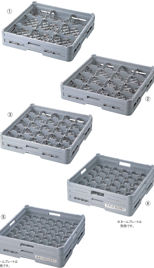
※ネームプレートは別売です。