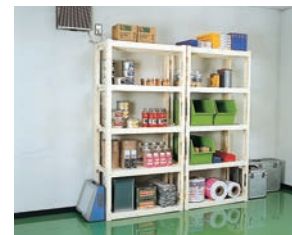
◀工場内整理棚として