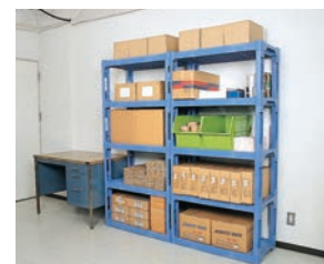
◀倉庫内整理棚として