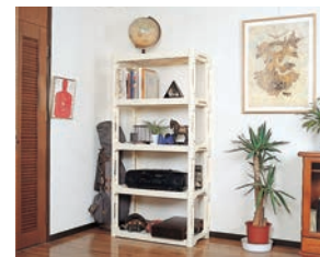
◀室内ラックがわりに

工具を使用せず、簡単に組み立てできるプラスチック製の棚です。 組み立て方法:工具・ネジを必要とせず簡単ラクラク