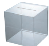
⑱ 応募箱 A41434