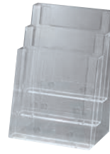
③ カタログホルダー 3C230 (A4判3段)