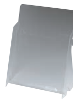
⑦ カタログホルダー A190 (B5判)