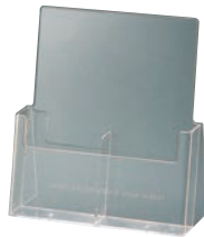
⑨ パンフレットスタンド 2C-112