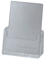
⑤ カタログホルダー C230 (A4判)