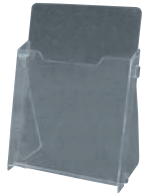
⑥ カタログホルダー A230 (A4判)