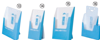
ペーパーリーフスタンド