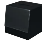
⑰ アンケートBOX A2562