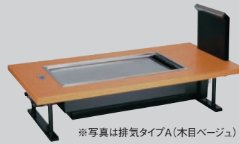
② お好み焼ロースター 熱くナイス 和卓 SOC-8040ED