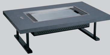
④ お好み焼ロースター ちょっと熱くナイス 和卓 HHN-6036D