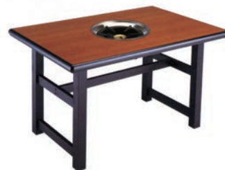
⑥ 鍋物テーブル ブラウン天板タイプ