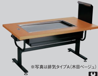
① お好み焼ロースター 熱くナイス 洋卓 SOC-8040ED

鉄板部分が天板より少し下がっているため、鉄板にふれにくい構造です。キャビネットの内部で熱をさましてから放出しますので、化粧枠にふれても熱くなく、火傷などをしない安全設計。ひざ元も熱くありません。ガスの点火確認も一目でわかる確認窓付です。