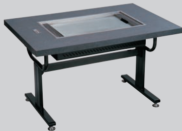
③ お好み焼ロースター ちょっと熱くナイス 洋卓 HHN-6036D