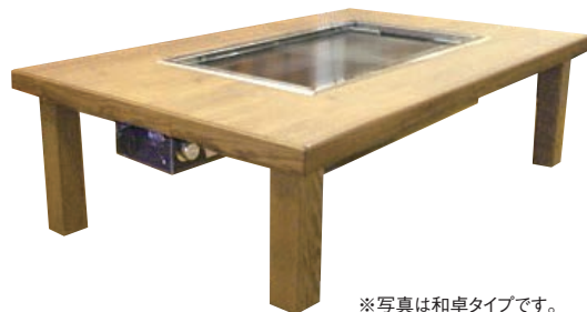
※写真は和卓タイプです。