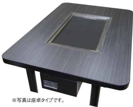
※写真は座卓タイプです。