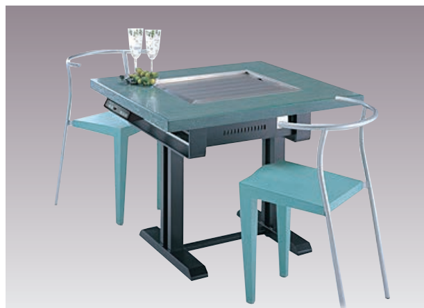
※写真は洋卓タイプです。