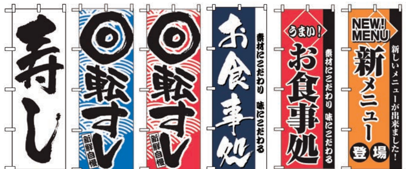
㉗ ㉘ ㉙ ㉚ ㉛ ㉜