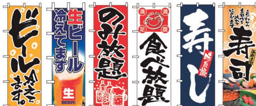
㉑ ㉒ ㉓ ㉔ ㉕ ㉖