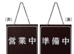
⑧ えいむ オープンプレート 営業中・準備中 茶 加