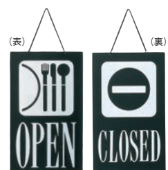
⑤ えいむ オープン・クローズプレート ブラック 加