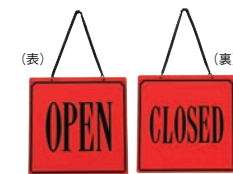
⑥ えいむ オープン・クローズプレート レッド 加