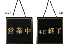
⑨ えいむ オープンプレート 営業中・本日終了 黒 加