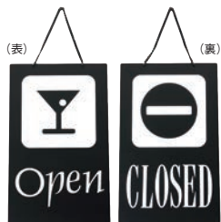
④ えいむ オープン・クローズプレート ブラック 加