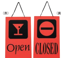
③ えいむ オープン・クローズプレート レッド 加