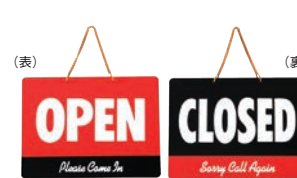
⑫ カナディアン オープンプレート 加