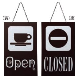
② えいむ オープン・クローズプレート ブラウン 加