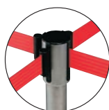
4方向パーティションとしても使えます