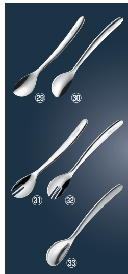
18-8 UDカットスプーン 小・Lハンドル