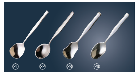
18-8 グラタンズプーン