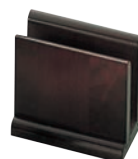
③木製 メニューブック立て 加