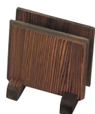
⑤木製 メニューブック立て 加