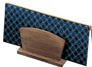
⑦シンビ メニューブックスタンド 加