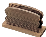
⑥シンビ メニューブックスタンド 加