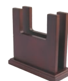
⑮木製 メニュー立て 加