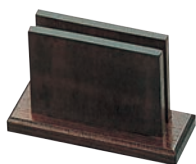
①木製 メニューブック立て 加