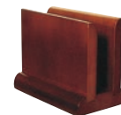
⑫木製 メニュー立て 加