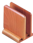
⑩木製 メニュー立て ナチュラル