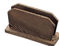
⑧シンビ メニューブックスタンド 加