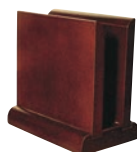
⑬木製 メニュー立て 加