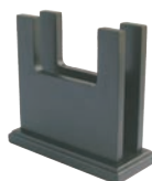
⑭木製 メニュー立て 加