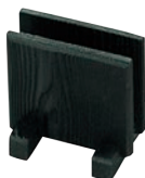
②木製 メニューブック立て 加