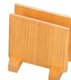
④木製 メニューブック立て 加