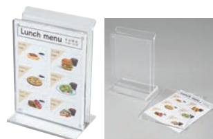
⑪ アクリル POPホルダー付メニュースタンド 縦