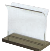
④ パウチメニュースタンド