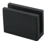
① シンビストーン メニューブックスタンド 黒