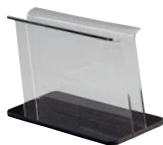
⑤ アクリルメニュー ブック立て (大)