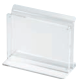
⑩ アクリル POPホルダー付メニュースタンド 横