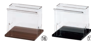
えいむ アクリル ナフキン&ブック立 NT-26