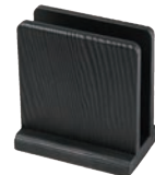
③ 樹脂製 メニュー立て ブラック