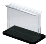
⑦ シンビ メニューブックスタンド 小