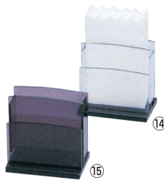
えいむ アクリル ナフキン&ブック立 NT-12