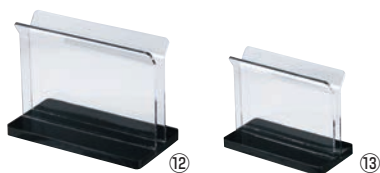
えいむ アクリル ブックスタンド