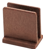
② 樹脂製 メニュー立て ライトブラウン