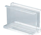
⑥ シンビ メニューブックスタンド