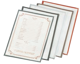
⑮ えいむ クリアテピング メニューブック TA-48 ㊦