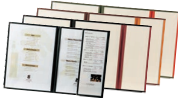
⑨ えいむ クリアテピング メニューブック LTA-46S ㊦