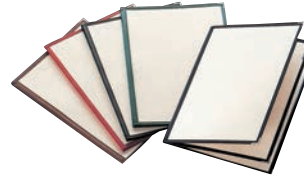
⑤ えいむ クリアテピング メニューブック LTA-46 ㊦