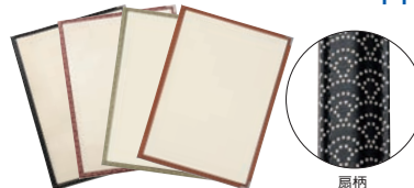
⑩ えいむ PP布地クリアテピング メニューブック PTA-442 ㊦

230×315 (A4・4ページ) 125×315 (A4½・2ページ) ※変則ミツ折タイプ