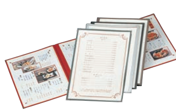
⑭ えいむ クリアテピング メニューブック TA-46 ㊦