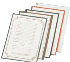
⑫ えいむ クリアテピング メニューブック TA-42 ㊦