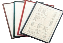
③ えいむ クリアテピング メニューブック LTA-44 ㊦