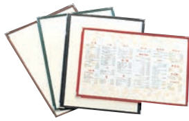
① えいむ クリアテピング メニューブック LTA-42 ㊦