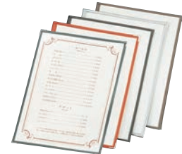
⑬ えいむ クリアテピング メニューブック TA-44 ㊦