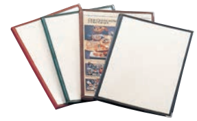
⑦ えいむ クリアテピング メニューブック LTA-48 ㊦