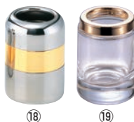
⑱メタリック ようじ入れ