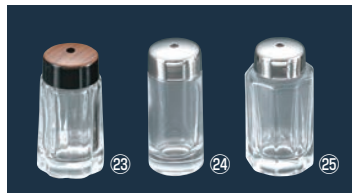
㉓ガラス 69 木目 ようじ入れ