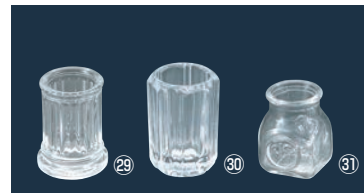
㉙ガラス 80N ようじ立 (蓋無) スキ