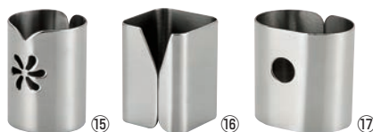
UK 18-8 ようじ立