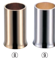
丸 ようじ立 No.220