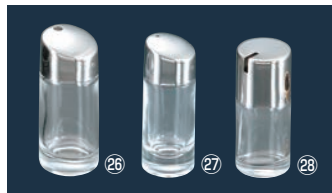
㉖ガラス #900 ようじ入れ