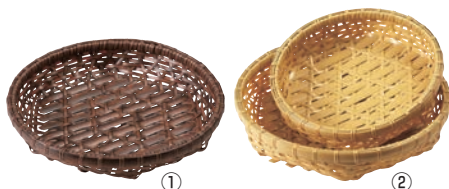
①樹脂オードブル茶