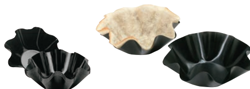
⑦ トルティーヤバイカー (小) 4pc 71