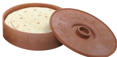
⑥ トルティーヤキーパー 71