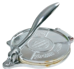
① トルティーヤプレス (小) 71