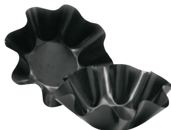
⑨ トルティーヤバイカー (大) 2pc 71