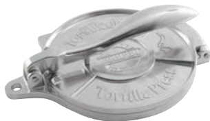
② トルティーヤプレス (大) 71