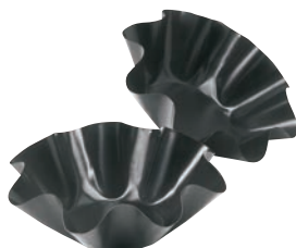
⑧ トルティーヤバイカー (中) 2pc 71