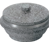
⑨長水 遠赤 石焼釜 (石蓋付) 補強リング付