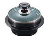
⑧長水 遠赤 石焼釜 (ガラス蓋付) アルミブラックコート枠付