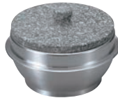
⑦長水 遠赤 石焼釜 (石蓋付) アルミ枠付