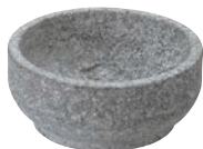
①長水 遠赤 石焼ビビンバリング無