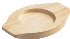
⑫EBM 石焼ビビンバ用 木台