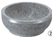
②長水 遠赤 石焼ビビンバ 補強上リング付