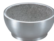
④長水 遠赤 石焼ビビンバ アルミ枠付