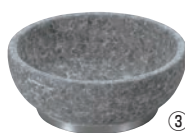
③長水 遠赤 石焼ビビンバ 補強下リング付