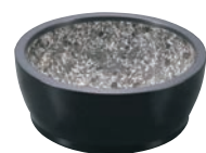
⑥ハードコート 石焼ビビンバ アルミ枠付 (艶消ブラック)