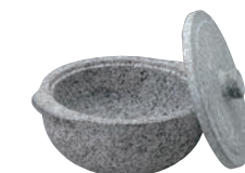
⑪長水 遠赤 石鍋 (石蓋付) 土鍋風