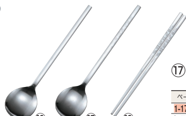
⑯18-0 無地 ビビンバスプーン