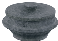
⑩長水 遠赤 石焼釜 (石蓋付) 補強リング無