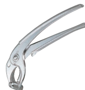
⑲石焼ビビンバ用 ヤットコ