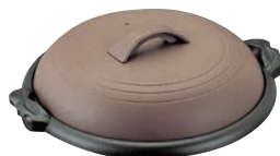
⑰アルミ 陶板焼 素焼き茶