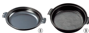
アルミ 陶板焼 ミニ皿