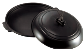
⑭アルミ 丸型 陶板焼 黒