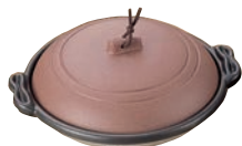
⑬アルミ 庵陶板鍋 素焼き茶