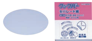
⑳クックパー 業務用 セパレート紙 丸型 ㊦ (陶板・セイロ用500枚入)