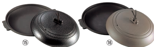
⑮アルミ 丸型 陶板焼 いぶし銀