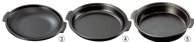
アルミ 陶板焼 皿