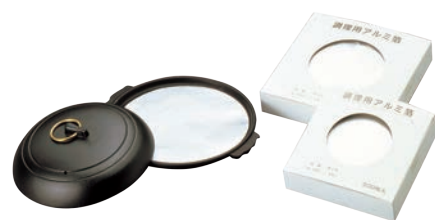
㉓調理用 アルミ箔 (500枚入)