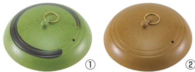
アルミ 陶板焼 蓋