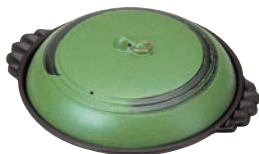
⑱アルミ ジャンボ 陶板焼 ありそ

●大型サイズの陶板で、盛皿としても使用できます。 ●皿はフッ素3層コーティングで耐久性に優れています。