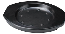
⑭耐熱樹脂 グリル台 ブラック