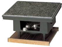
①石焼調理器 百万石 ㊦