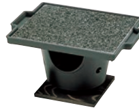
③石焼調理器 十万石 ㊦