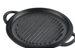
㉒IK ミニグリルプレート

220×150×H25 ●フッ素3層コーティングによりこげつきにくく洗い落としが楽です。