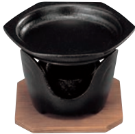
⑥SN 六角型 卓上焼ミニ皿セット ㊦