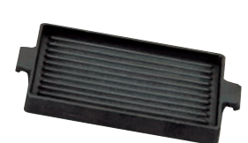
㉓アルミ テフロン 焼物板