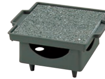
④石焼調理器 五万石 ㊦