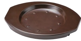
⑮耐熱樹脂 グリル台 ブラウン

180×235×H22 底内径:φ130 材質:ポリプロピレン 耐熱温度:200℃