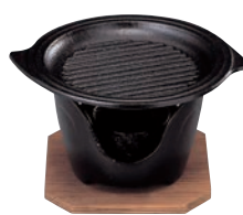
⑧SN 丸型 グリル 卓上焼ミニ皿セット ㊦