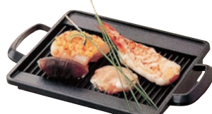
㉑焼物プレート さざ波

φ180×H30 ●コンロセットにセット可能です。 ●フッ素3層コートでこげつきにくく洗い落としが楽です。 ●コンロセットはP1756-23小をご使用ください。