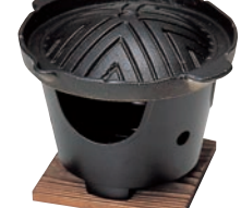
⑲アルミ ジンギスカン鍋セット