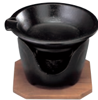
⑦SN 片口 卓上焼ミニ皿セット ㊦