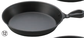
⑫丸型グリル鍋 17cm 片手