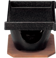
⑩SN 角型 卓上焼ミニ皿セット ㊦