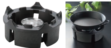
⑯樹脂製 グリルこんろ ブラウン