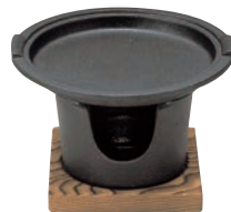
⑰アサヒ 焔ばた コンロセット