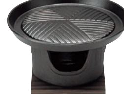
⑱アサヒ スタミナ コンロセット