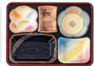
副食固定 F-148-PP 洗