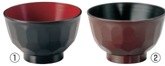
① 無地 亀甲 汁椀