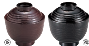
⑱ 荒筋木目椀 3寸

外寸:φ96×H99 容量:200ml 材質:耐熱ABS樹脂 耐熱温度:100℃