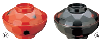
⑭ 亀甲 汁椀