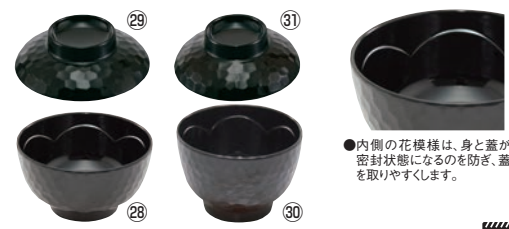
メラミン 亀甲汁椀 溜内黒