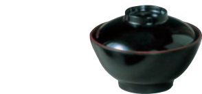
⑯ カスミ 汁椀 No.13W 内朱

外寸:φ120×H57 340ml 材質:メラミン 耐熱温度:120℃ 蓋付高さ:87