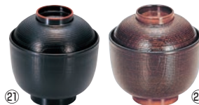
㉑ 千筋ケヤキ小吸椀 3寸

外寸:φ93×H98 容量:180ml 材質:耐熱ABS樹脂 耐熱温度:100℃