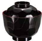
⑬ ニュー亀甲小吸物椀 黒内朱