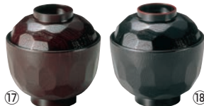
⑰ 亀甲 小吸物椀