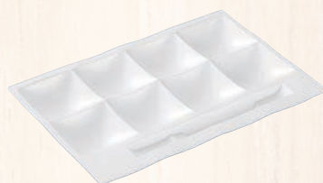
①「和」テイスト ビュッフェプレート 陶磁器調 (スーパーハード塗り) ㊦