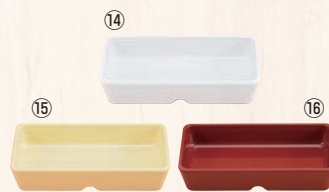
スクエアパーツ・ポーション 2/9 M-2392 ㊦