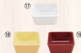
スクエアパーツ・ポーション 1/9 M-2391 ㊦