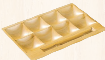
④「和」テイスト ビュッフェプレート 白木(刷毛目) ㊦