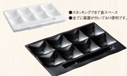
③「和」テイスト ビュッフェプレート 黒 ㊦