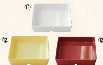
スクエアパーツ・ポーション 4/9 M-2394 ㊦