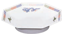
⑪ 八角皿 M-31-R

φ198×H80 1,050ml 5653900 φ200×H56 810ml 5654000 耐熱温度:120℃