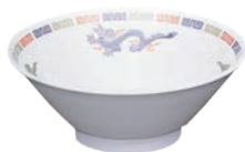
⑧ タンメン丼 M-56-R