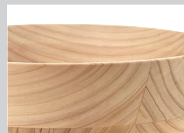
マットコーティング