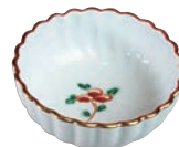
⑤ 朱金見込花菊型小鉢 EC20-19 ページコード 商品コード 価格 1-1657-0501 1133020 ¥1,350 φ104×H45