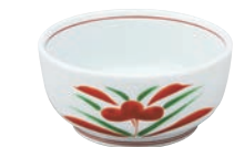
① 赤絵中鉢 EC5-38 ページコード 商品コード 価格 1-1657-0101 4166010 ¥1,560 φ116×H54