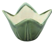
⑪ 織部ゆり小鉢 EC6-50 ページコード 商品コード 価格 1-1657-1101 2944590 ¥1,140 85×85×H65