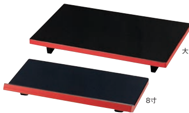
⑦DX盛台 黒淵朱 取寄