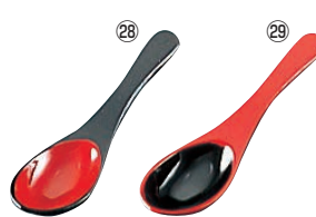
和風塗り レンゲスプーン