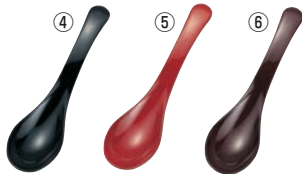
おじyasプーン (小) 71