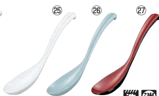
メラミン チリレンゲ M-590 71