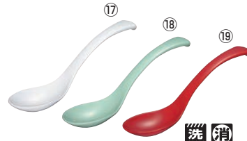
メラミン ユニレンゲ L5 71