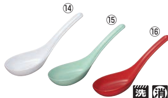
メラミン 七八レンゲ L3 71