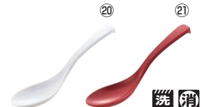
メラミン ユニレンゲ L6 71