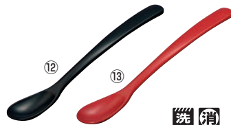
メラミン スプーン 小 71