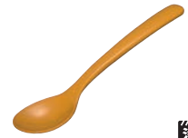
⑪メラミン スプーン 71