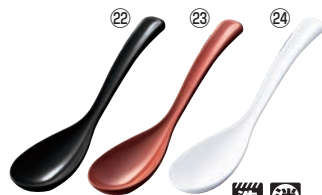
メラミン ビタれんげ 57-5 71