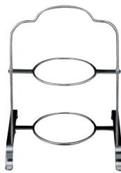
⑩ミスタースリム 18-8 ハイティースタンド 2段 MR-415 カ

235×H425 (対応プレート:123~213mm) 皿受リング内径:φ125