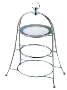
④UK 18-8 アフタヌーンティースタンド 3サイズ用

300×H375 (対応プレート:170~200mm) 皿受リング内寸:φ160 ※プレートは別売です。 ※銀メッキ仕上