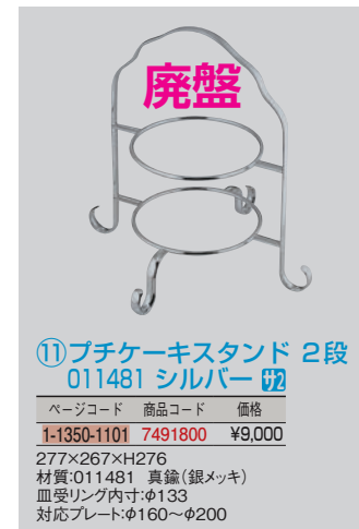
⑪プチケーキスタンド 2段 011481 シルバー カ

235×H302 (対応プレート:123~213mm) 皿受リング内径:φ125