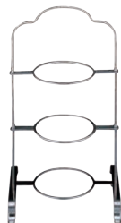
⑨ミスタースリム 18-8 ハイティースタンド 3段 MR-417 カ