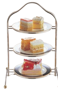
③UK 18-8 アフタヌーンティー スタンド