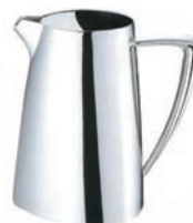
③UK 18-8 トライアングル ウォーターポット