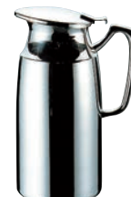
⑭SW 18-8 T型 二重ポット