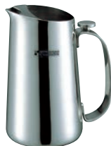
⑤18-8 リッチ ウォーターピッチャー RC-02