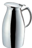
⑮SW 18-8 マリン 二重ポット