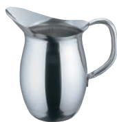
①EBM 18-8 ペリカン ウォーターポット (氷止め無)