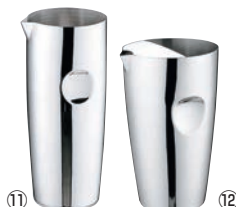
UK 18-8 ウォーターピッチャー