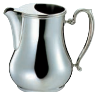
⑥SW 18-8 ビクトリア ウォーターポット (アイスガード付)