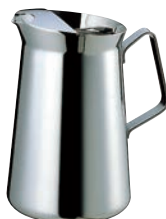
⑦SW 18-8 ET型 ウォーターポット (アイスガード付)