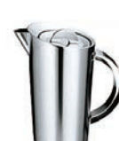
⑱MA 18-8 ニューウォーターポット