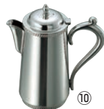
SW 18-8 ウォーターポット