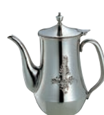
㉑18-8 ダイヤ ローズ DX ウォーターポット