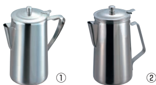
EBM ステンレス ウォーターポット