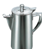
⑰MA 18-8 ウォーターポット