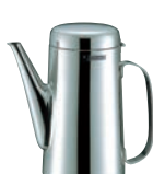
⑯18-8 リッチ ウォーターピッチャー RC-03 ㊦㊧