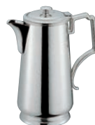
⑧H 洋白 N型 ウォーターポット ㊦㊧㊨㊩