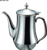
⑳18-8 ダイヤ DX ウォーターポット