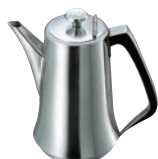
⑮SW 18-8 PC柄 ウォーターポット