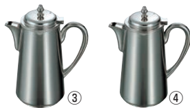
UK 18-8 ウォーターポット 1.8ℓ