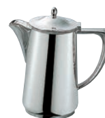
⑨H 洋白 小判型 ウォーターポット ㊦㊧㊨㊩