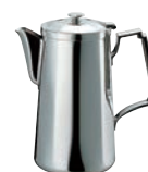
⑭SW 18-8 角 ウォーターポット