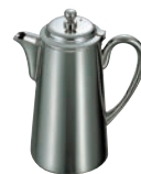
⑤UK 18-8 M型 ウォーターポット