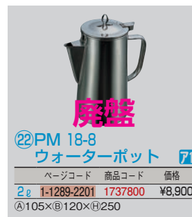
㉒PM 18-8 ウォーターポット ㊦㊧