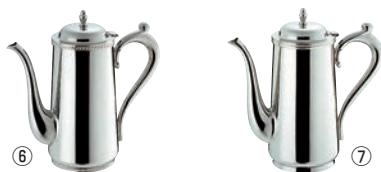
SW 18-8 コーヒーポット