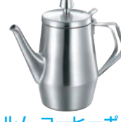
⑫K 18-8 エルム コーヒーポット オールステンレス