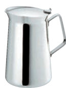
⑧SW 18-8 ET型 コーヒーポット