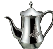
⑨18-8 ダイヤローズ コーヒーポット