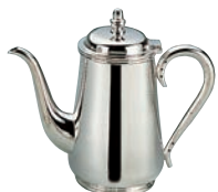
⑬H 洋白 東型 コーヒーポット