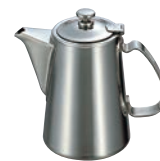
⑤UK 18-8 チボリ コーヒーポット