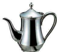
⑩18-8 ダイヤ コーヒーポット