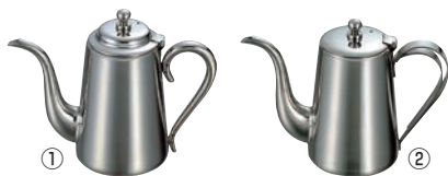
①UK 18-8 M型 コーヒーポット