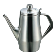
⑪K 18-8 エルム コーヒーポット