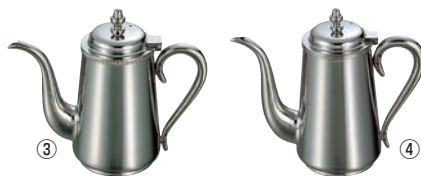
UK 18-8 コーヒーポット