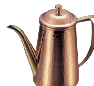
⑮銅 槌目入 コーヒーポット