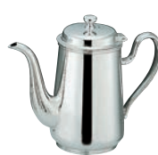
⑭H 洋白 ウェスタン型 コーヒーポット