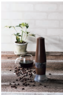
⑤京セラ セラミック電動コーヒーミル 研