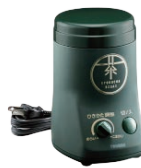
⑥お茶ひき器 緑茶美採 研