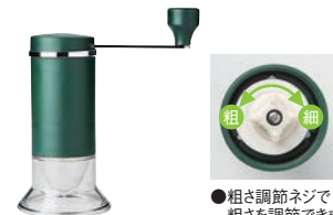
⑦ミルル セラミックお茶ミル 研