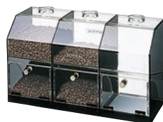
⑨ボンマック コーヒーケース 研 直 A