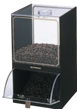
⑧ボンマック コーヒーケース 研 直 A