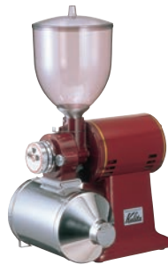
②カリタ ハイカットミル 直 B