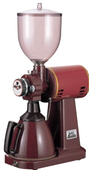
①カリタ タテ型 ハイカットミル 直 B