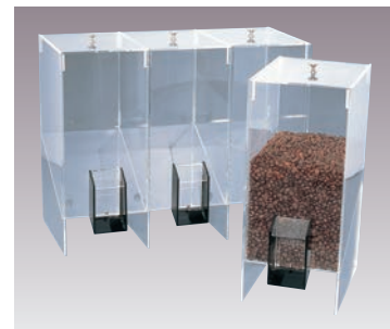
⑩アクリル コーヒービーンズディスペンサー 研 直 A