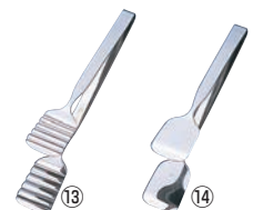
ZY 18-0 ブレッドトンガ #2000