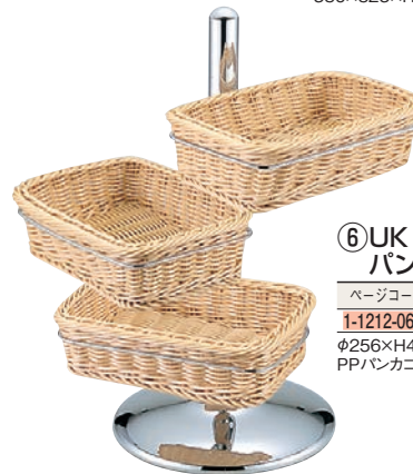
⑥UK 18-8 PP 角 パンカゴスタンド