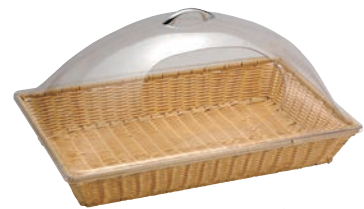
③角型 カバー付 バスケット