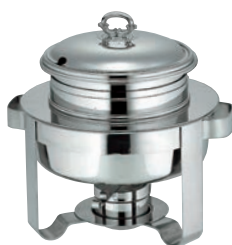
⑧SW 18-8 A型 丸 スープステーションマークII 13インチ