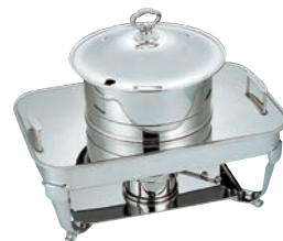
③UK 18-8 角 スープステーションS