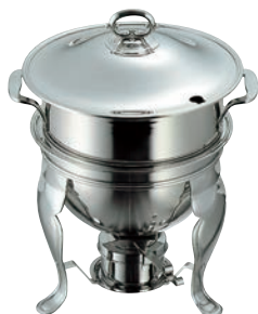
④UK 18-8 スープウォーマー 8ℓ