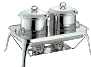
⑥SW 18-8 スープステーション