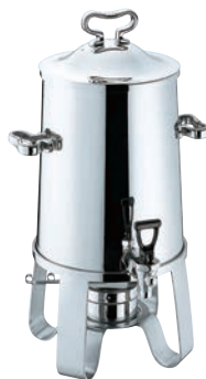
⑪SW 18-8 コーヒーアーン