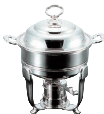
⑤UK 18-8 バロン スープチューフィンク