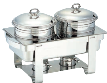
⑦SW 18-8 A型 角 スープステーションマークII 20インチ