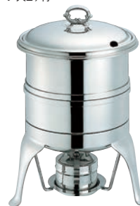
⑨SW 18-8 S型 スープウォーマー (レードルスタンド付)