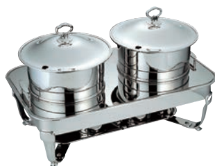
②UK 18-8 角 スープステーションL