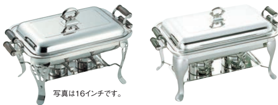
写真は16インチです。