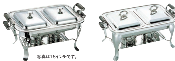
写真は16インチです。