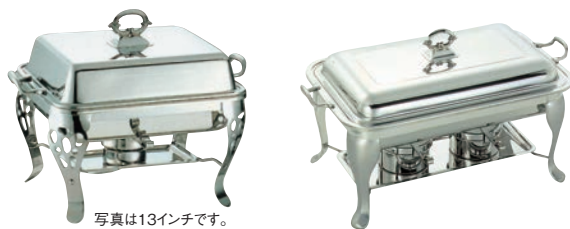
写真は13インチです。