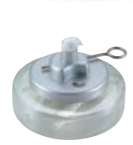
④ ヒートエースα デラックス ロータイプ