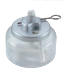
③ ヒートエースα デラックス 6H