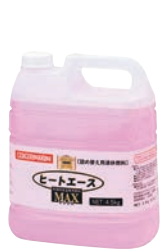
⑥ ヒートエースマックス 詰替専用 液体燃料 4ℓ