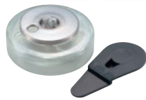
② ヒートエースα スタンダード ロータイプ