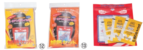
モーリアン ヒートパック ハイパワー 加熱セット