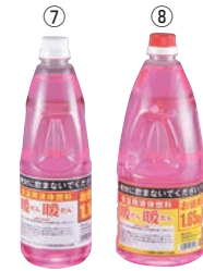
暖暖 (保温用液体燃料)