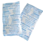
⑪ モーリアン ヒートパック

※⑥～⑧の液体燃料はアルコール燃料ではありませんのでアルコールランプには使用しないでください。