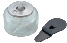
① ヒートエースα スタンダード 6H

③ 専用漏斗を使って燃料を補充します。(補充キャップをお使いいただくと便利です。)