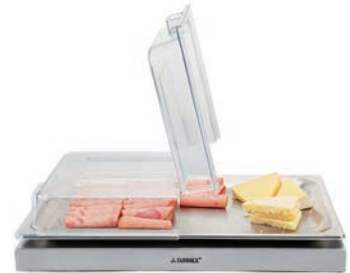
カバー適合表をご参照ください。