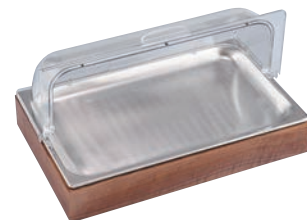
③ EBM 木枠 アイスディスプレイセット