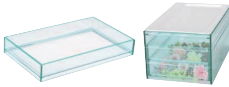
⑧ スタンド 外枠 グリーン ㊦

外寸:528×323×H80 板厚:6mm ●ガストロノーム規格に沿っていますので、陶器製ガストロノームパンと組合せご使用ください。(3/4のみ) ●別売の中枠を使えば重ねがで、立体感が得られます。 ●LEDキャンドル等を入れてディスプレイすると、より豪華です。