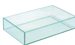
⑫ アイソボックス グリーン ㊦

外寸:530×325×H110 板厚:8mm ●底板付ですので中に氷を入れ、ジュースピッチャーやサラダボール等を入れます。また、ガストロノーム規格ですので、GN規格フードパンを入れてもご使用いただけます。