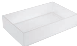
⑪ アイソボックス フロスト ㊦

外寸:513×308×H8 板厚:8mm ●⑦、⑧の外枠には別売の天板を受ける為のツメが付いています。外枠と天板の組み合わせを上下逆さまにすることで、天板としてご使用いただけます。り、底板としてご使用いただけます。