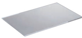
⑩ グリーン・フロークリア兼用 天板 ㊦

外寸:513×308×H73 板厚:8mm ●システムビュッフェスタンド外枠を積み重ねて使う時の中枠としてご使用ください。