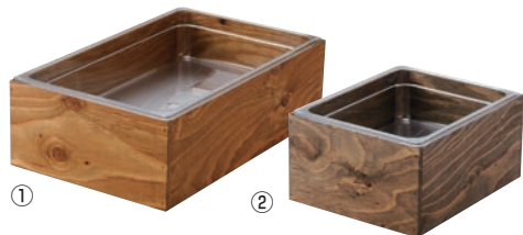
① EBM 木枠 アイソボックス