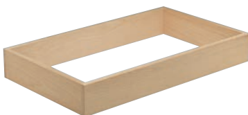
⑥ スタッキング用木枠

P1069-②メラミン ガストロノームパンの1/1・2/4・1/2・1/3・2/3(2/3が1枚と1/3が1枚の組み合わせ)も ご使用いただけます。高さ100mmは木枠を2段以上にスタッキングしてご使用ください。