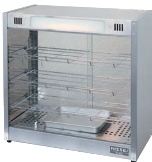
②ホットショーケース NH-603 ㉔