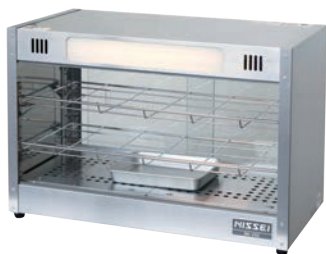
①ホットショーケース NH-302 ㉔