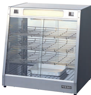
④ホットショーケース NH-703 ㉔