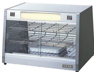
③ホットショーケース NH-502 ㉔