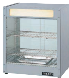
⑤ホットショーケース NH-204 ㉔