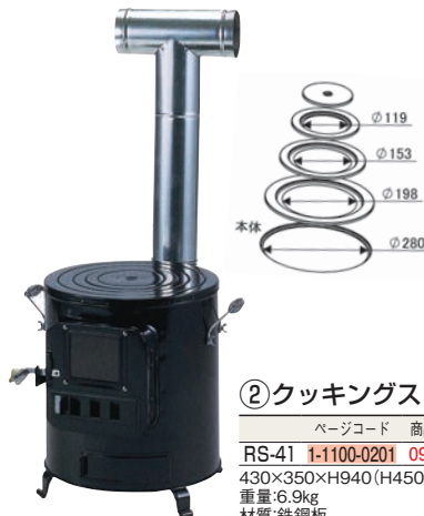
② クッキングストーブ