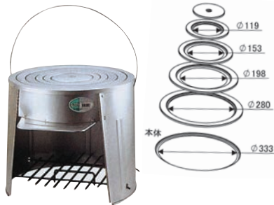
④ 丸カマド (大)