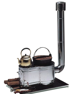
③ 薪ストーブセット ASS-60 時計1型