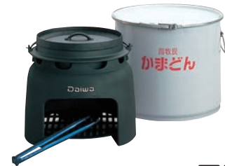
⑥ かまどんオープンセット