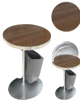
⑤ パーチスタンド サークル木目 1591518 74

ページコード 商品コード 価格 1-1096-0401 1540370 ¥32,000 外寸:φ387×H600・650・700 材質:ステンレス、ABS 重量:8.1kg ●インテリアのようなシンプルさを持った 試食 / 商品提案テーブルです。 ●天板色はシックなブラウンです。 ●高さは3段階調整可能です。