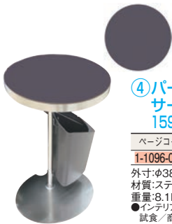
④ パーチスタンド サークルBR 1591516 74

ページコード 商品コード 価格 1-1096-0301 1541410 ¥3,000 外寸:400×350×H190 材質:ポリスチレン 重量:1.2kg ●パーチスタンド スクエア用カバーです。