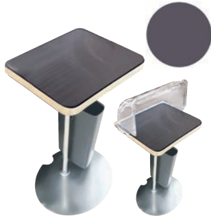
① パーチスタンド スクエアBR 1591509 74

ページコード 商品コード 価格 1-1096-0101 1540330 ¥26,000 外寸:387×327×H600・650・700 材質:ステンレス、ABS 重量:7.4kg ●インテリアのようなシンプルさを持った 試食 / 商品提案テーブルです。 ●天板色はシックなブラウンです。 ●高さは3段階調整可能です。 ※写真のフードカバースクエアは別売です。