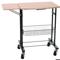
⑦ スナップワゴン2 フレームタイプ 1530853-3 74

ページコード 商品コード 価格 1-1096-0601 1541400 ¥3,600 外寸:φ400×H215 材質:ポリカーボネート 重量:1.4kg ●パーチスタンド サークル用カバーです。