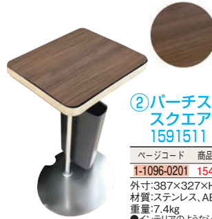
② パーチスタンド スクエア木目 1591511 74

ページコード 商品コード 価格 1-1096-0101 1540330 ¥26,000 外寸:387×327×H600・650・700 材質:ステンレス、ABS 重量:7.4kg ●インテリアのようなシンプルさを持った 試食 / 商品提案テーブルです。 ●天板色はシックなブラウンです。 ●高さは3段階調整可能です。 ※写真のフードカバースクエアは別売です。