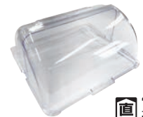
③ フードカバースクエア セルフ用・パーチ用 1510851 74

ページコード 商品コード 価格 1-1096-0201 1540350 ¥30,000 外寸:387×327×H600・650・700 材質:ステンレス、ABS 重量:7.4kg ●インテリアのようなシンプルさを持った 試食 / 商品提案テーブルです。 ●天板色は商品を引立たせるウォールナット 柄です。 ●高さは3段階調整可能です。