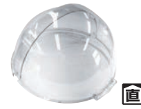
⑥ フードカバーサークル パーチスタンド用 1591522 74

ページコード 商品コード 価格 1-1096-0501 1540390 ¥34,000 外寸:φ387×H600・650・700 材質:ステンレス、ABS 重量:8.1kg ●インテリアのようなシンプルさを持った 試食 / 商品提案テーブルです。 ●天板色は商品を引立たせるウォールナット 柄です。 ●高さは3段階調整可能です。 ※写真のフードカバーサークルは別売です。