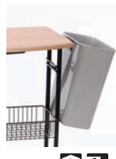
⑨ 試食品ケース トングタイプ 33650 73

ページコード 商品コード 価格 1-1096-0801 1541440 ¥1,800 外寸:304×175×H350 材質:ポリプロピレン、スチール 重量:1.0kg ●スナップワゴン2用のゴミ箱です。