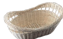
⑲ 籐製 パンカゴ