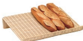
⑪ 籐製 フランスパンスタンド 横置浅型