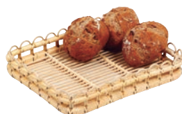
② 籐製 芯盛カゴ 角長