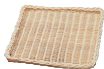
⑩ 籐製 浅型かご