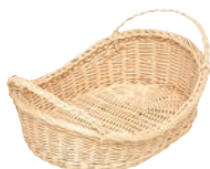
⑰ 籐製 耳付 舟型かご