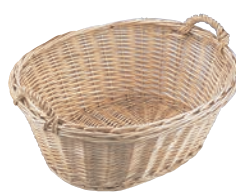
⑮ 柳製 耳付 小判カゴ