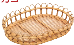
① 籐製 芯盛カゴ 小判