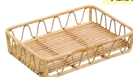
③ 籐製 芯盛カゴ 角長深