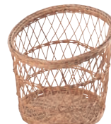
⑫ 籐製 フランスパンスタンド