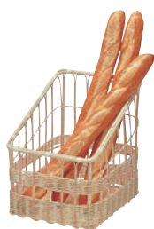
⑬ 籐製 フランスパンスタンド