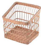
⑭ 籐製 フランスパンスタンド