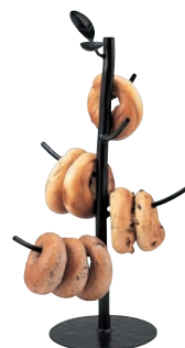
⑯ スチール ベーグルスタンド