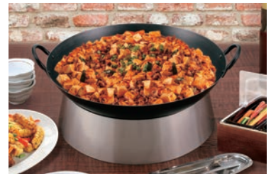
中華鍋はP169・P170をご参照ください。

組み合わせやすいサイズ展開でスタッキングもOK カラフルな彩りは、アイキャッチ効果を高めます。