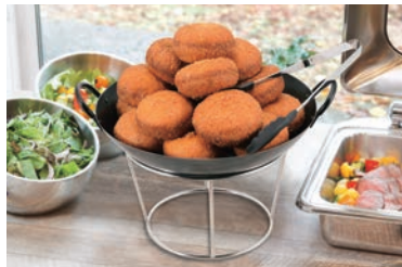
中華鍋はP169・P170をご参照ください。