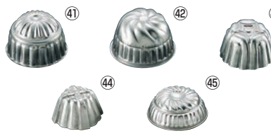
FK アルミ ゼリー型 (中)