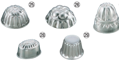
FK アルミ ゼリー型 (中)