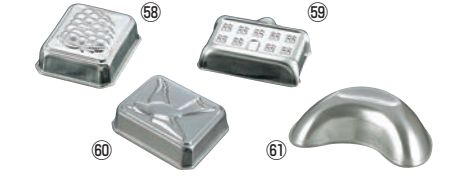
FK アルミ ゼリー型