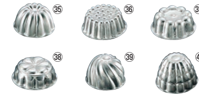
FK アルミ ゼリー型 (中)