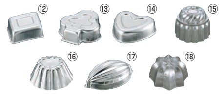
FK アルミ ゼリー型 (大)