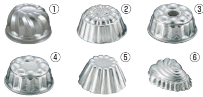
FK アルミ ゼリー型 (大)