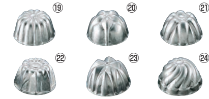
FK アルミ ゼリー型 (中)