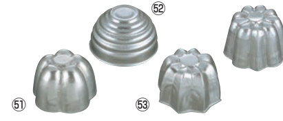
FK アルミ ゼリー型 (小)