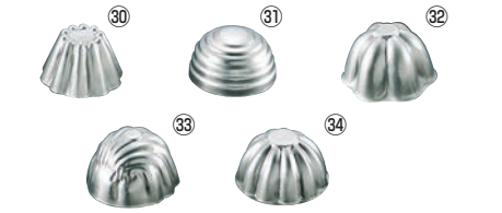
FK アルミ ゼリー型 (中)