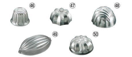
FK アルミ ゼリー型 (中)