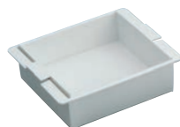
⑧PC 電子レンジ用 流し缶 (目盛付) No.1565 小