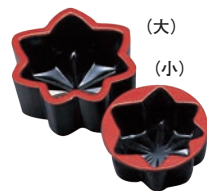
⑮PC 錦玉型 紅葉

内寸:207×63×H43 材質:アクリル樹脂(耐熱温度80℃/耐冷温度-30℃)