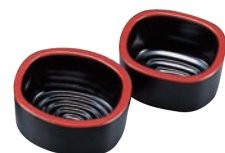
⑯PC 錦玉型 小判