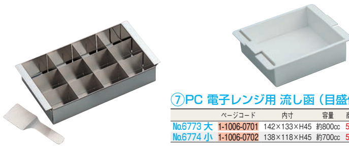
⑥18-8 L型 デザート 寒天流し 12ヶ取 (ヘラ付)