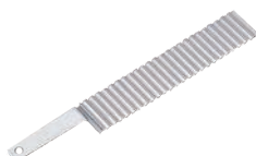
⑩T 背なし 寒天切 中目