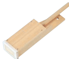
⑪木製 寒天ゼリー突(PC刃)