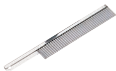
⑨T 背付 寒天切 細目