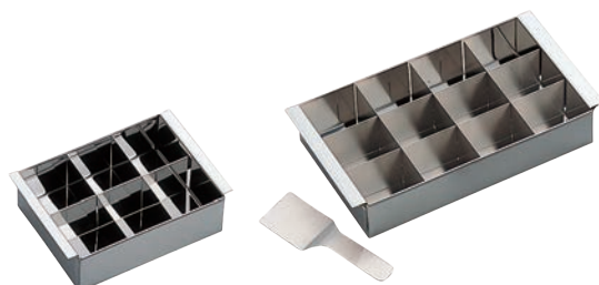
⑤18-0 デザート 寒天流し 6ヶ取