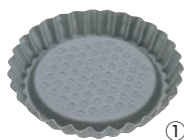
①タルトレット丸 中