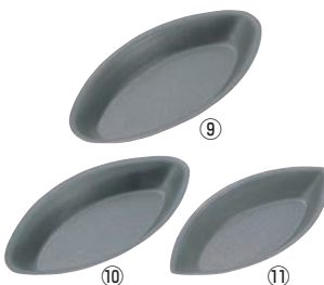
⑨ムジタルトボート 大