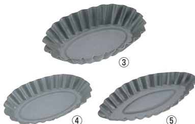
③タルトレット小判 大