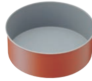
⑪トッピングオレンジ デコレーションケーキ型