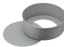
③ベイクウェア フッ素樹脂加工 デコレーション型 底取