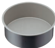
⑨ブラックフィギュア デコレーションケーキ型