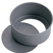
②アルブリット セパトデコ型 底取