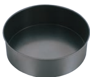
⑧EBM プリキ スーパーコート デコレーション型 共底