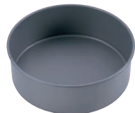
⑩アルブリット デコ型 共底