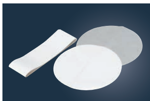
⑫デコレーションケーキ型用 敷紙 (30枚入)