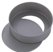
④ベイクウェア フッ素樹脂加工 チーズケーキデコ型 底取