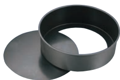
①EBM プリキ スーパーコート デコレーション型 底取